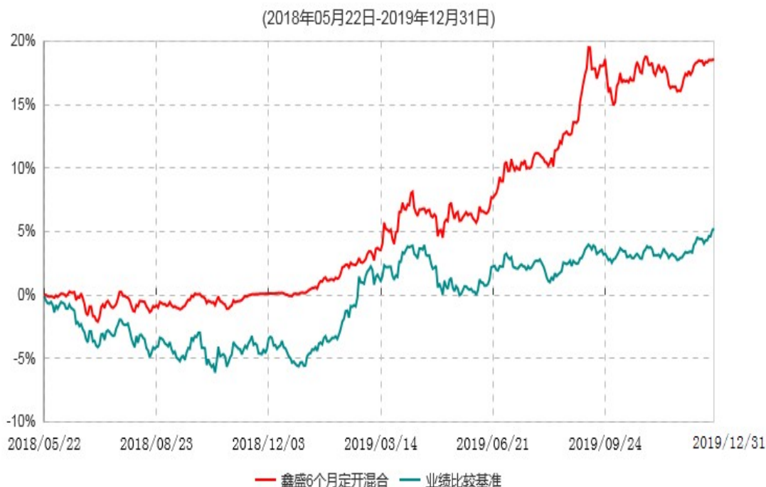
财通资管鑫盛6个月定期开放混合型证券投资基金累计净值增长率与业绩比较基准收益率历史走势对比图

注：自基金合同生效至报告期末，财通资管鑫盛6个月定期开放债券基金份额净值增长率为18.64%，同期业绩比较基准收益率为5.25%。